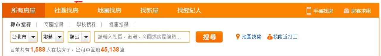
图.5 591 租房网检索条件

在这一页面大家就可以按照各种检索条件搜索房源，笔者觉得该网站好用之处在于，可以直接按照“学校搜寻”，即大家点击“学校搜寻”后，选择自己的学校即可搜到学校附近的所有房源；“捷运搜寻”是按照捷运站搜房源；“地图找房”则会直接将所有房源标在地图上，也很好用。还有就是，检索条件里的“类型”是指房屋类型，选项里的“整层住家”是指面积很大、条件很好的整个套房，当然价位也很高；“独立套房”是指面积一般在 30 平方米左右的小套房，类似酒店的双人标间，包含独立卫生间、基本的家具，有的还有开放式厨房，价位适中，但一般只能住下 2 人；“分租套房”指一套房子的不同卧室分别租给不同的人，客厅和厨房等空间共用。详见下图：