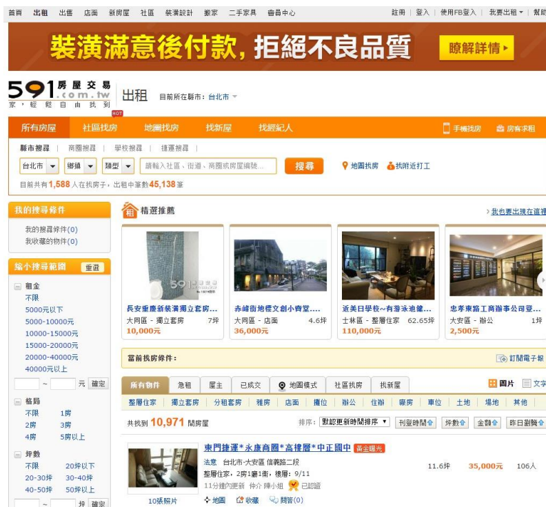
图.4 591 租房网

如果无法从老师或熟人那里获得信息，自己在台湾又没有朋友，只能自己寻找房源的话，这里笔者就为大家推荐一个很好用的台湾本地的租房网站（类似大陆的 58 同城之类）：591 房屋交易网（ http://www.591.com.tw/ ），直接百度“591”也可以找到。该网站的好处就在于它是个比较纯粹的租屋网，很少广告等内容出现在网页上，在这里一般可以找到许多合适的房源。笔者在考虑租房的时候也曾用过该网站，来台湾后也向台湾的同学询问过，他们也推荐了该网站，所以大家可以考虑用用看。现在教大家如何使用，进入首页点“出租”，然后可以看到如下页面：