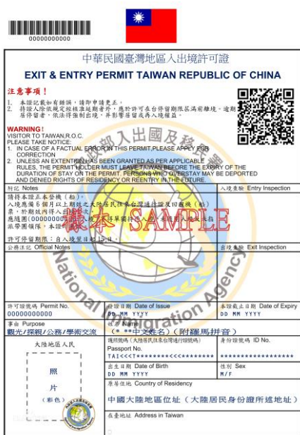
图 1. 入台证

在我们完成台湾学校要求的申请手续过后，台湾校方会帮我们申请“台湾地区入出境许可证（简称入台证）”，并随同学校的邀请函一起发来，所以耐心等待即可，入台证和邀请函是我们后面办理“大陆居民往来台湾通行证（简称通行证）”及签注的必要资料。