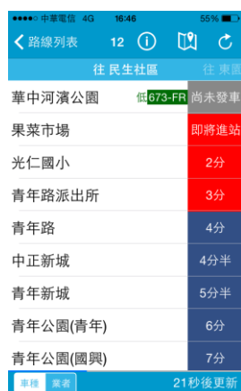
图.5 公车通

所以在这里，笔者也给大家推荐一个台湾本地的用来查询公车班次的 APP “公車通”，使用这个 APP 可以查询每个线路的公车在每一站的到站情况，它可以显示公车目前还有多久可以到达这一站，当大家不清楚班次时可以使用这个 APP，界面如下：