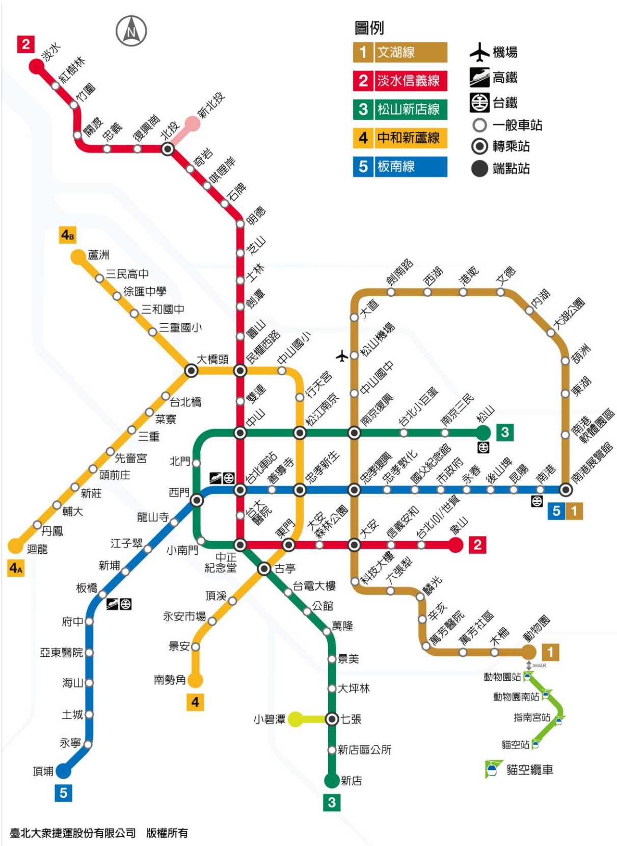
图.6 台北市捷运地图 (图片来源:台北捷运公司官网)

http://www.metro.taipei/ct.asp?xItem=78479152&CtNode=70089&mp=122035 )