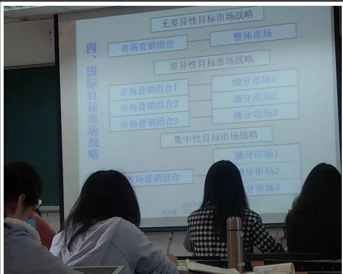
Figure 5 上課:國際市場營銷