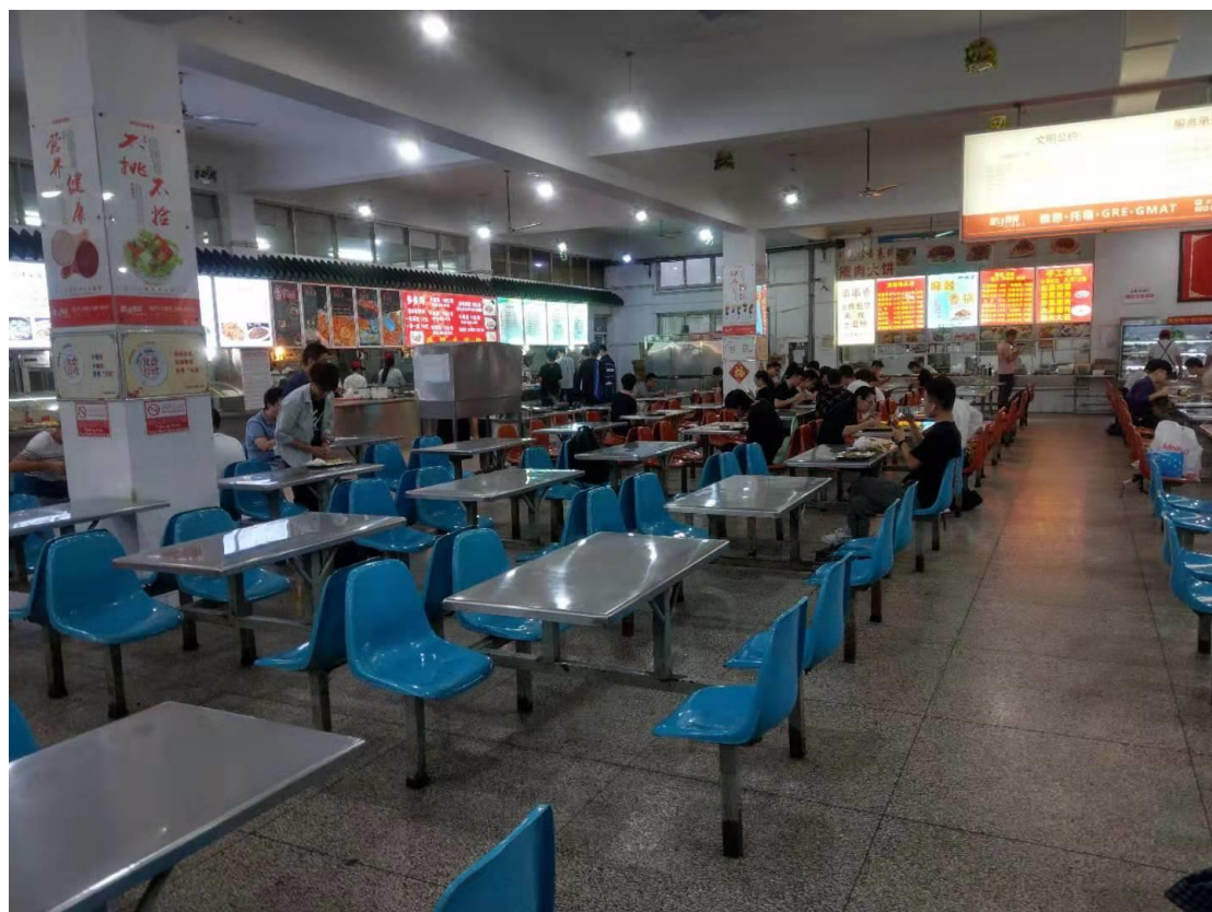
Figure 3 天賜莊東校區食堂內部