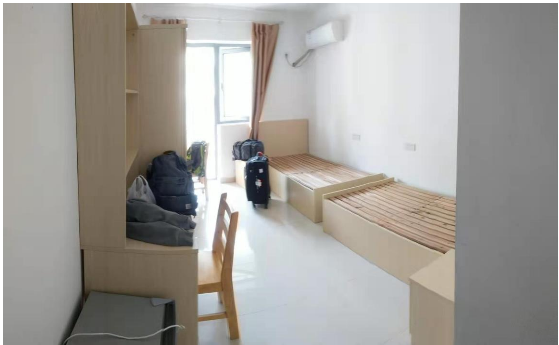
Figure 2 宿舍內部為兩人一間享獨立衛浴