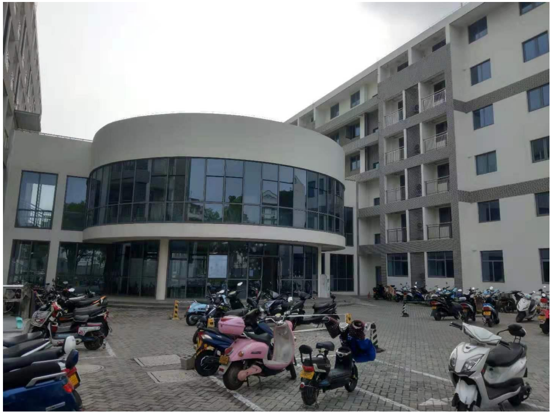
Figure 1 天賜莊校區留學生宿舍東 19