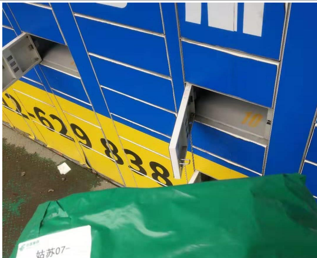
Figure 4 購買物品至近鄰寶取件